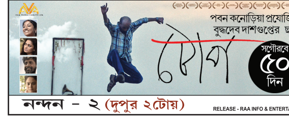
নন্দন - ২ (দুপুর ২টায়) RELEASE - RAA INFO & ENTERTAINMENTS